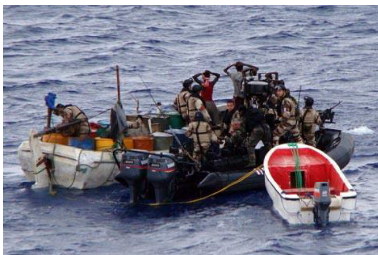
Saisie d'une embarcation de présumés pirates somaliens

Cependant les menaces de piraterie sur le plan international ne se sont pas estompées pour autant, elles se sont déplacées, avec deux zones qui restent particulièrement sensibles : l'Asie du Sud Est, et le Golfe de Guinée .